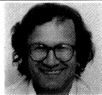
Thor Jensen Rettslære